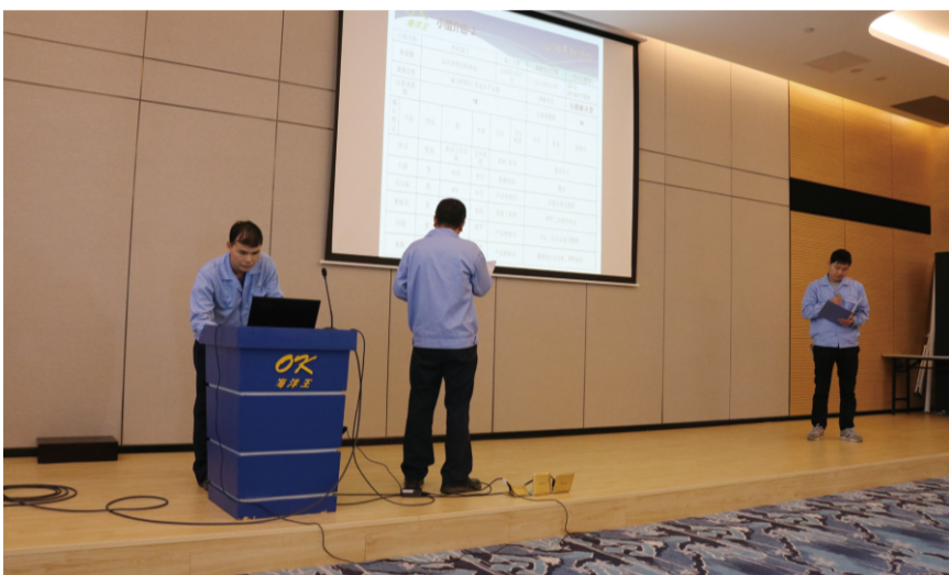
品质保证部春雷圈发表情景