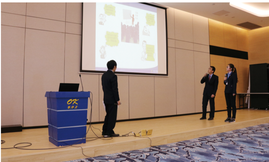
技术与设计部蓝精灵圈发表情景