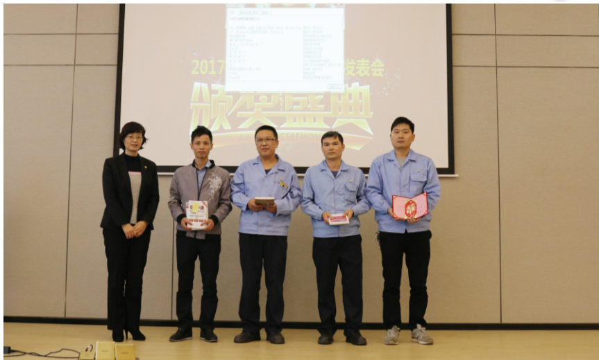
公司领导为获得一等奖的小组颁奖