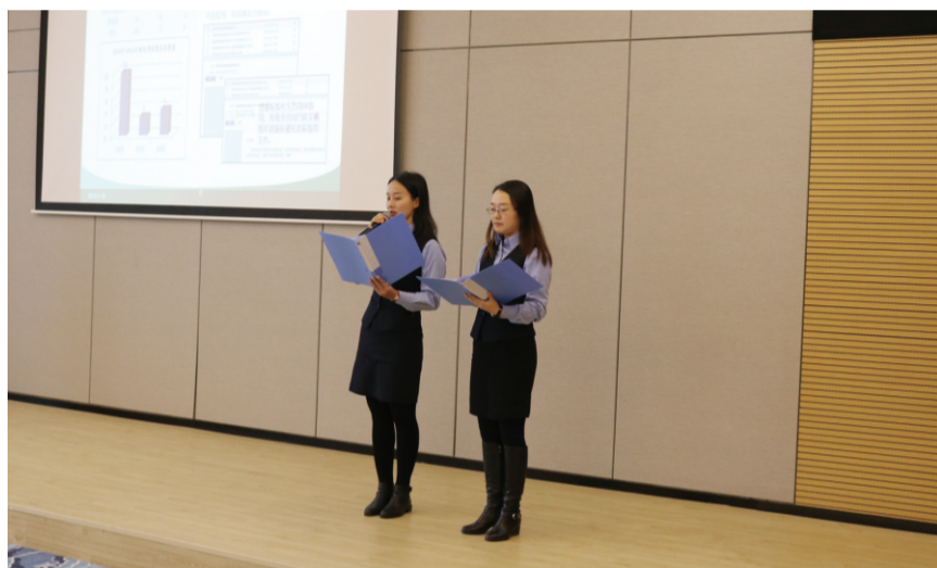
管理优化部花儿朵朵圈发表情景