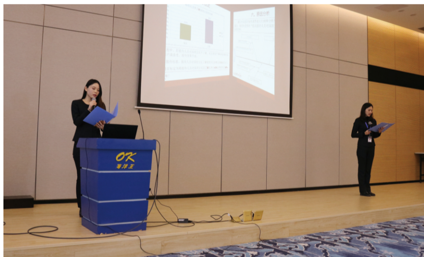
市场部阳光啦啦队圈发表情景