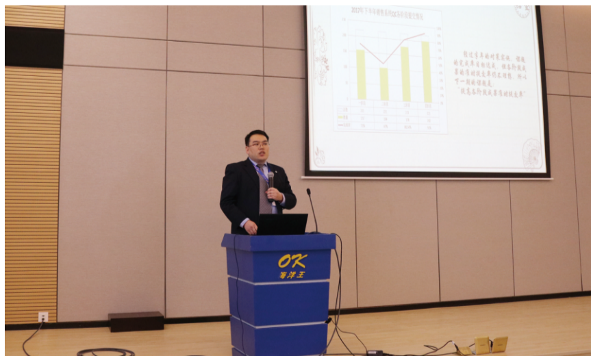
TQM推进部垂直管理圈发表情景