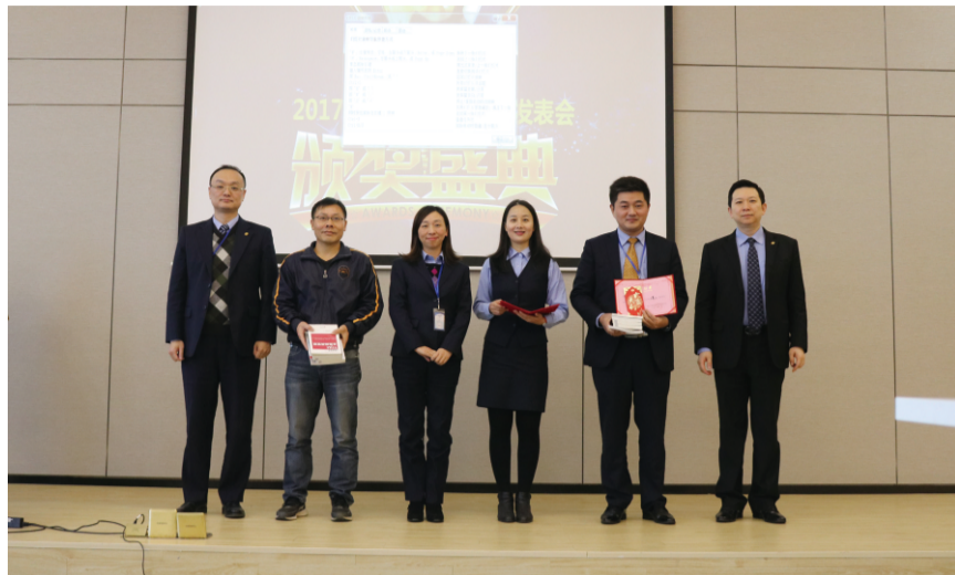
公司领导为获得二等奖的小组颁奖